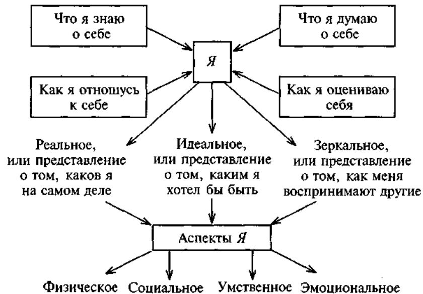
Рис. 2. Структура Я-концепции

ее характерные особенности. Схематически структуру Я-концепции можно изобразить следующим образом (рис. 2):